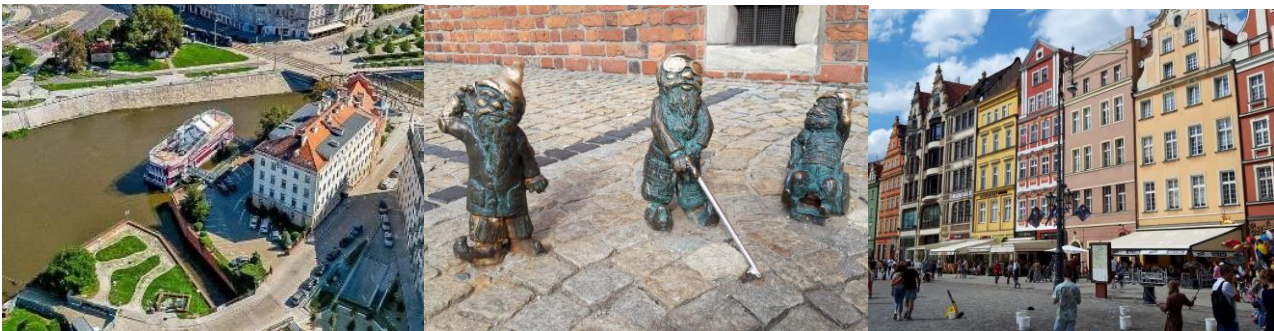
Hotel Great Polonia